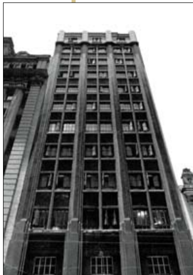
Primeira sede do Itaú

O Itaú teve origem no Banco Central de Crédito, constituído em 1943. Com a fusão ao Banco Itaú S.A, banco mineiro voltado ao crédito rural, concretizada em 1965, deu origem ao Banco Federal Itaú. A partir de então, foram 11 anos marcados por fusões e incorporações envolvendo os Bancos Sul Americano, da América, Aliança, Português do Brasil e União Comercial. Em 1974, foi criada a Itaúsa. A expansão continuou com as aquisições do Banco Francês e Brasileiro (1995), Banerj (1997) e Bemge (1998), Banestado (2000) e BEG (2001). Fez a associação com o Banco BBA Creditanstalt (2002) e incorporou o BankBoston (2006).