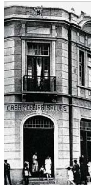
Primeira sede do Unibanco