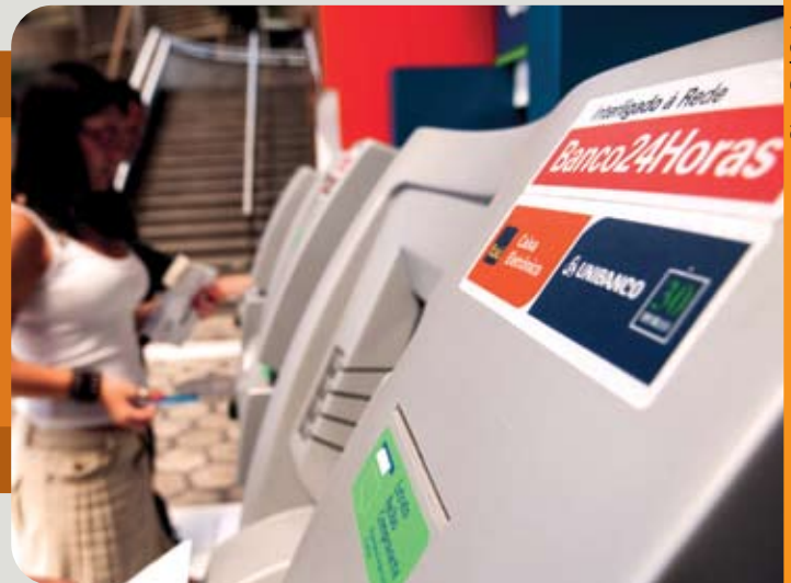
Pisco Del Gaioso

O Itaú Unibanco possui presença significativa no território brasileiro e une os 30,5 milhões de clientes do Unibanco e os 27 milhões do Itaú, nas mais diversas modalidades de negócios financeiros. Os clientes Itaú Unibanco contam agora com uma rede expressiva de 4,9 mil agências e postos de atendimento bancário (PABs) e mais de 30 mil caixas eletrônicos, presentes em 1.100 municípios do Brasil. A instituição disponibiliza também 300 operações exclusivas de serviços pela internet.