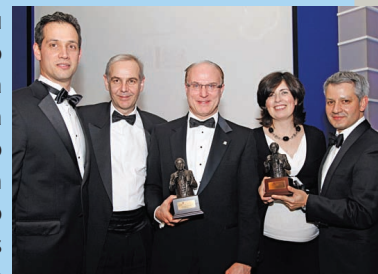
Executivos do Banco Itaú Europa na premiação

A revista The Banker elegeu o Itaú Unibanco como o melhor banco do Brasil e da América Latina, com a nota máxima no seu segmento e na pontuação geral. Foram analisados critérios como atendimento às necessidades dos clientes, complexidade das operações, capacidade de inovação e performance.